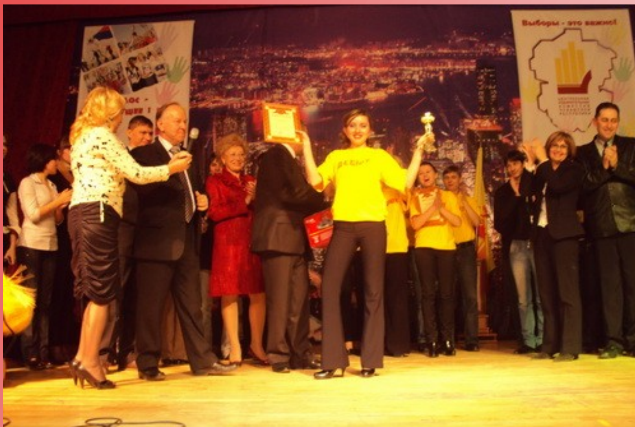
3 место в Республиканском конкурсе «Выборы—это важно» декабрь 2009 г.