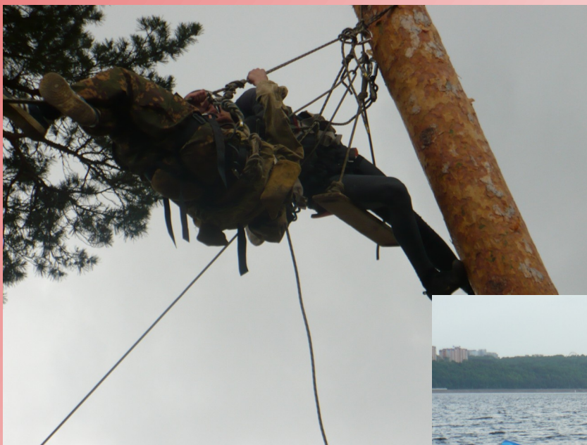
Полоса препят- ствий на «МолГород»-2010