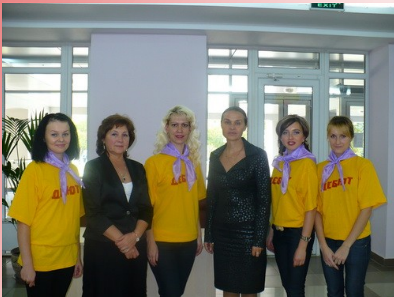
1 место в Республиканском форуме молодежи «Земля моя Чувашия»