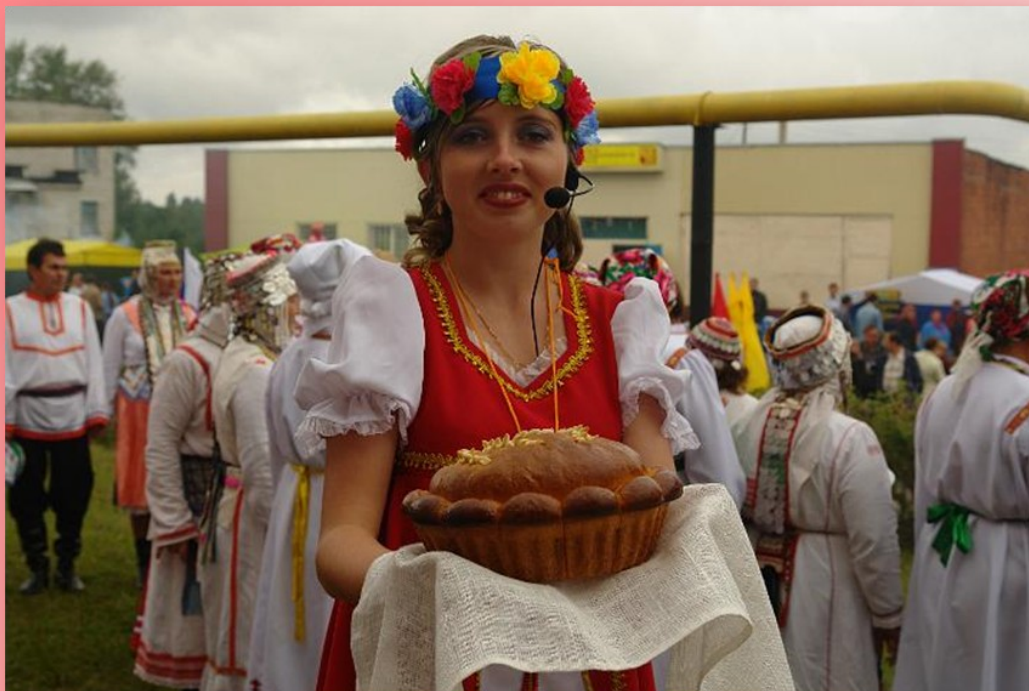
Председатель «Содружества молодежи»