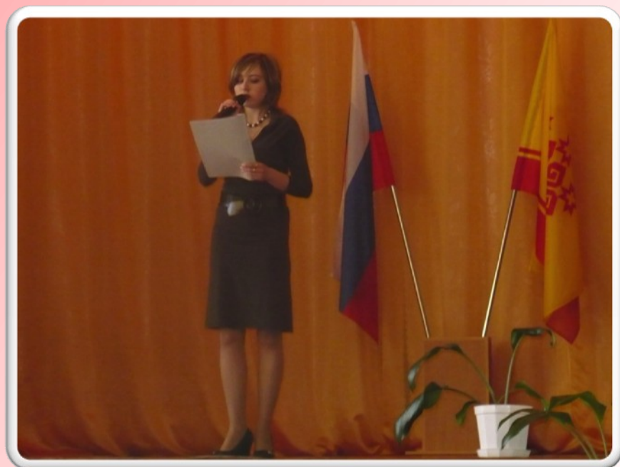
Вечер памяти посвященный участ- никам ликвидации на Чернобыльской АЭС, г. Шумерля 2009 г.