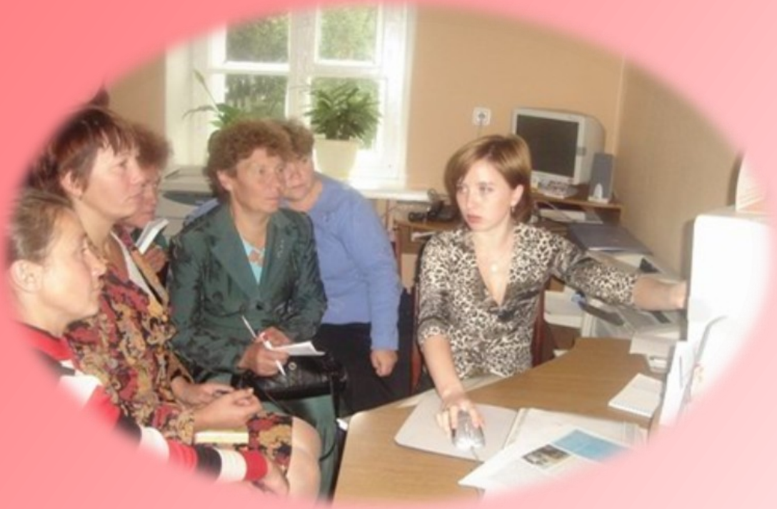
Занятие в школе компьютерной грамотности