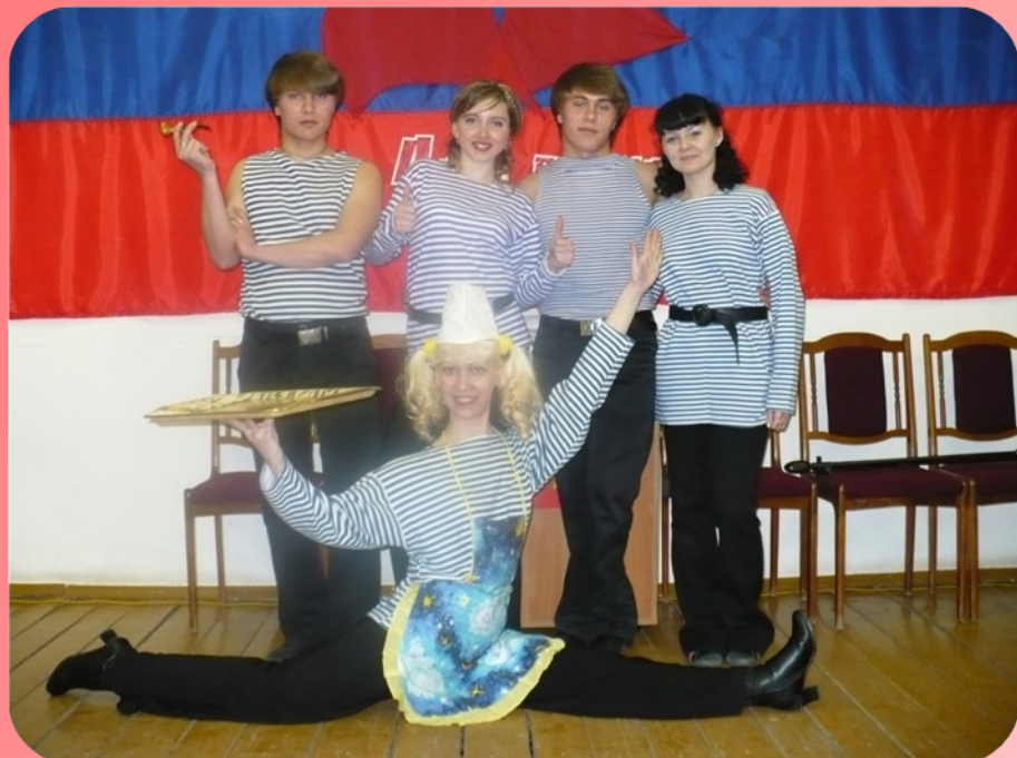
Открытие молодежного клуба «Алые паруса» Шумерлинского района, д. Шумерля апрель 2009 г.