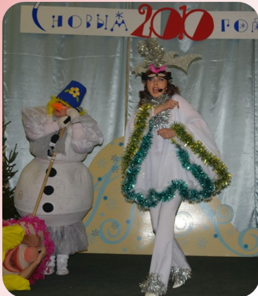
Корпоративный праздник Новый год