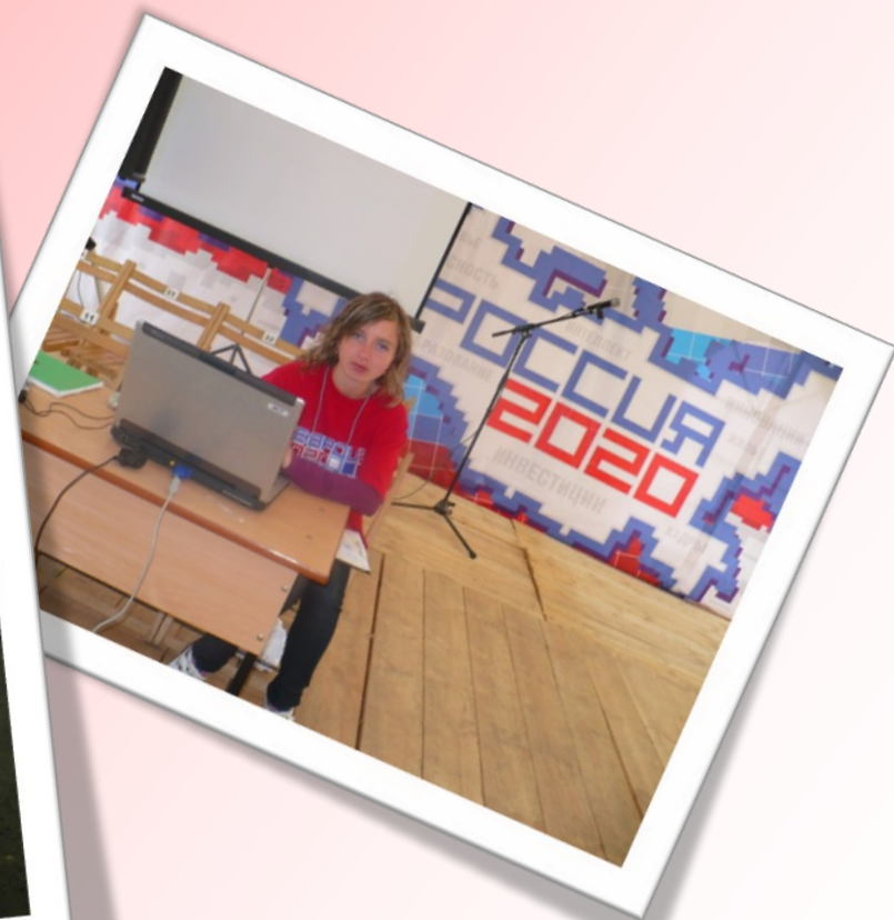
Всероссийский Федеральный лагерь «Гвардия 2020»