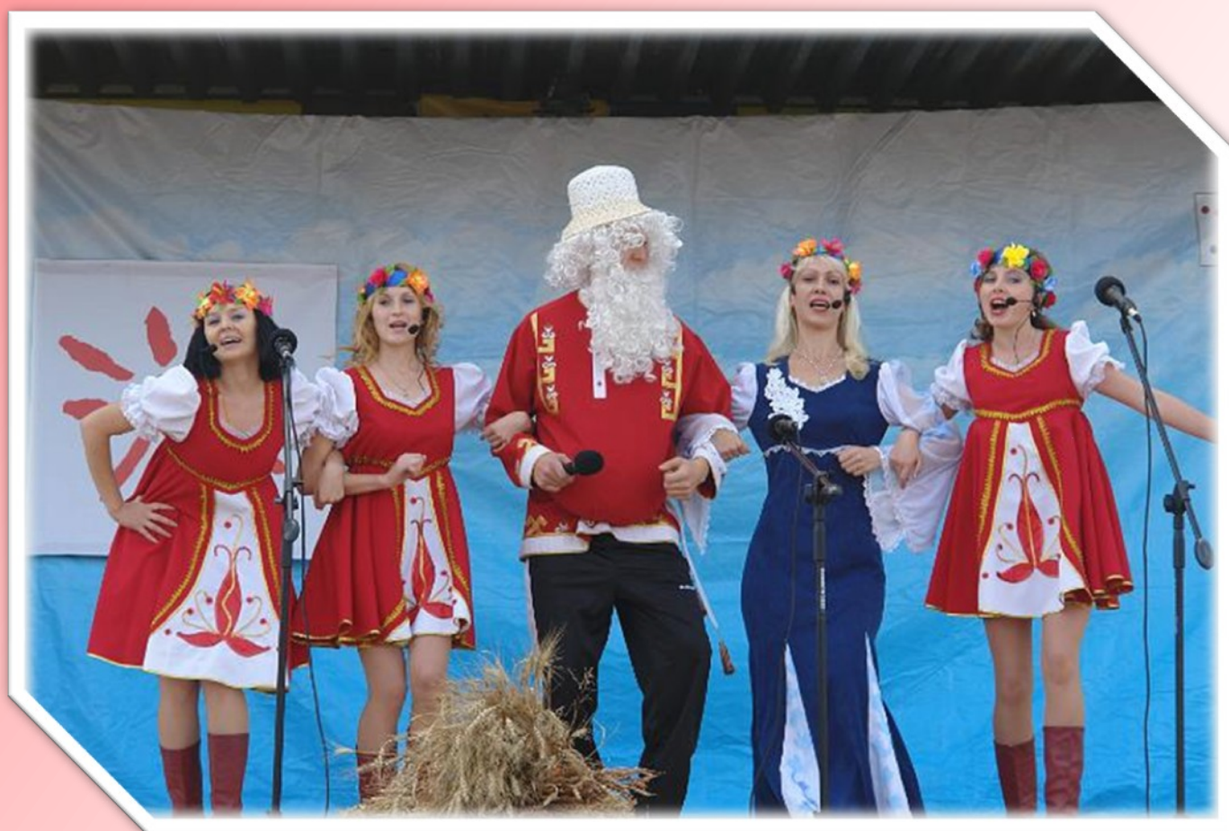
Межрайонный фестиваль дружбы «Истоки»