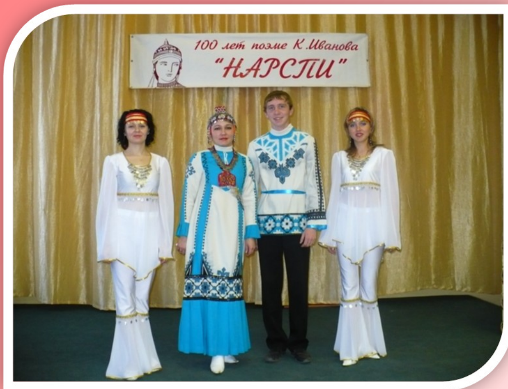
Музыкальная композиция «Нарспи-жемчужина поэзии чувашской»