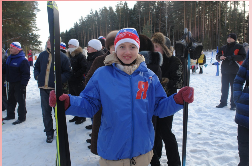
Лыжня России- 2010