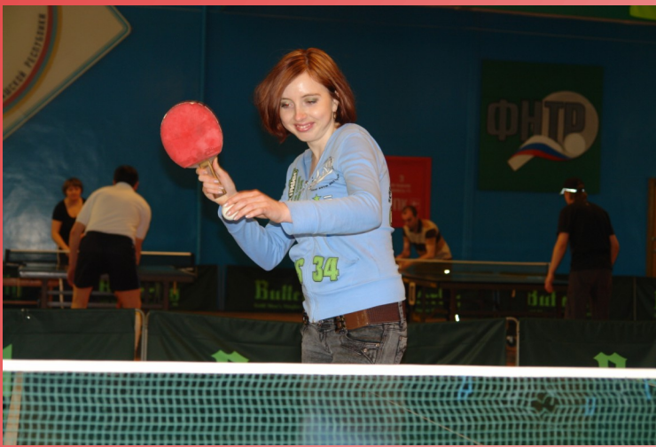
Финал Республиканских соревнований среди му- ниципальных служа- щих Чувашской Респуб- лики