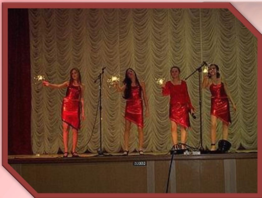
Акция «Молодежь за здоровый образ жизни»