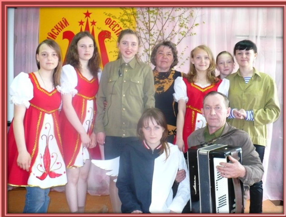
Фестиваль посвященный 65-летию Победы «Салют Победы». Студия «Дебют» представила постановку «Мы из будущего»