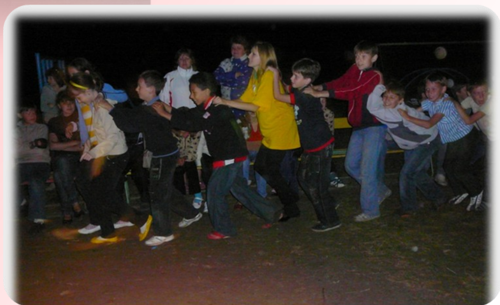
Танцевальный вечер «Разожги лето» в ДОЛ «Соснячек» - акция молодежь за здоровый образ жизни