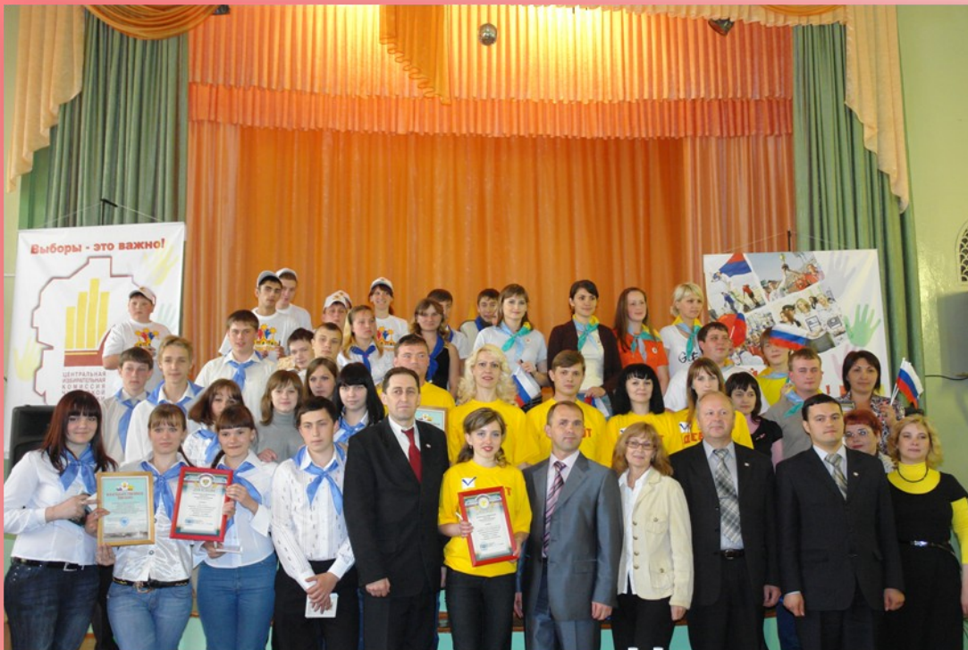
Победа на зональном этапе КВН «Выборы—это важно» май 2009 г.