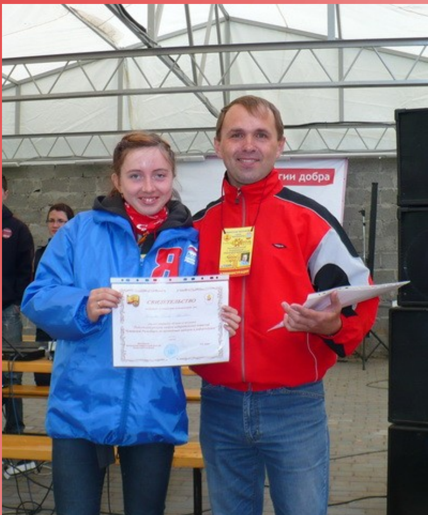
Свидетельство о включении в кадровый резерв Центральной избирательной комиссии